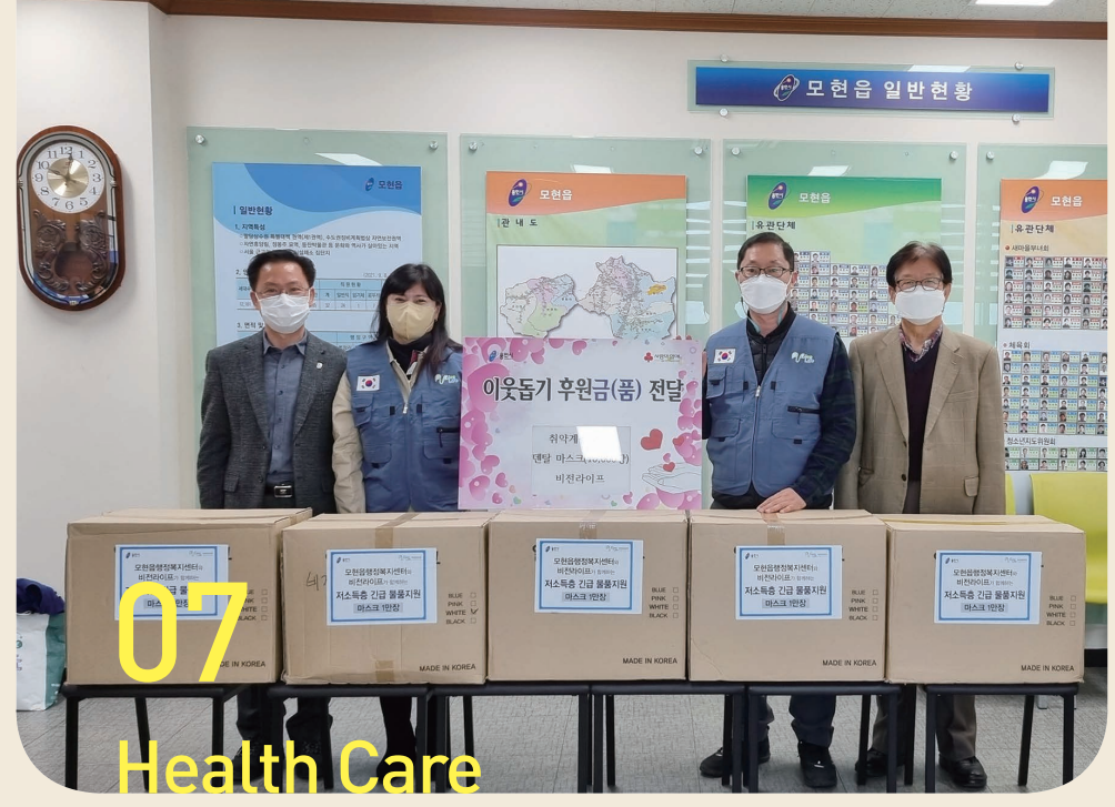
07 Health Care

앞으로도 해외뿐 아니라 국내 곳곳에 도움이 필요한 곳은 힘이 되어주는 비전라이프가 되도록 후원자님의 지속적인 관심과 사랑 부탁드립니다.