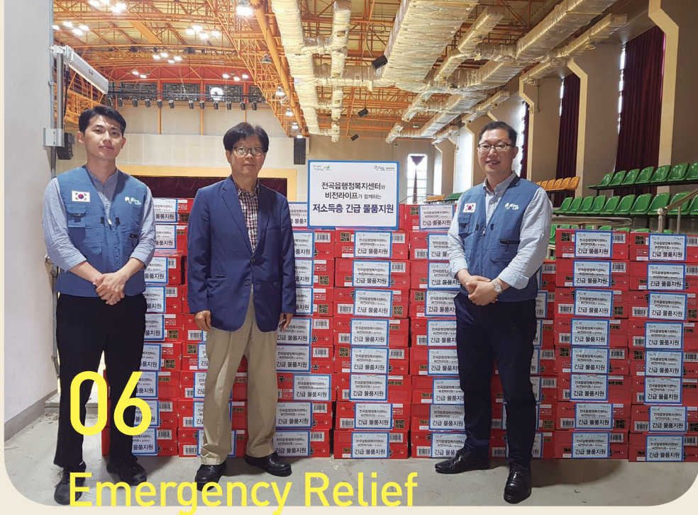
06 Emergency Relief